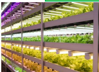
<人工光型植物工場>