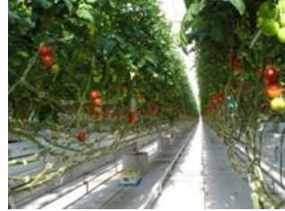
<太陽光型植物工場>