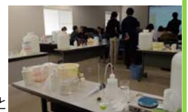
<対面開催時の実習の様子>

【募集期間】 2021年6月15日(火)~2021年7月26日(月) 13:00※入金確認が7/26 13:00までに可能なこと