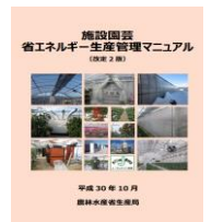
▲省エネマニュアル