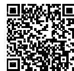
▲省エネ通知のページQRコード