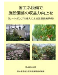
▲省エネで収益力向上を