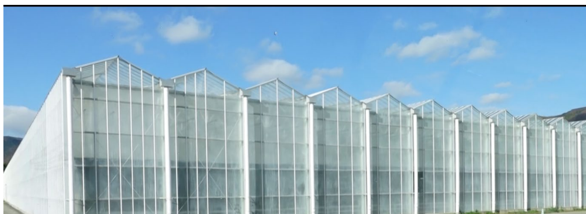
次世代施設園芸大分県拠点（愛彩ファーム九重）の外観

品種選定と収益性： 市場ニーズに合わせ、赤色パプリカを中心とした品種選定を行い、また栽培の容易な品種への切り替えを検討している。規格外品の活用や、地域での食と農の連携活動「サステナブル・ガストロノミー」を通じた付加価値向上に取り組んでいる。