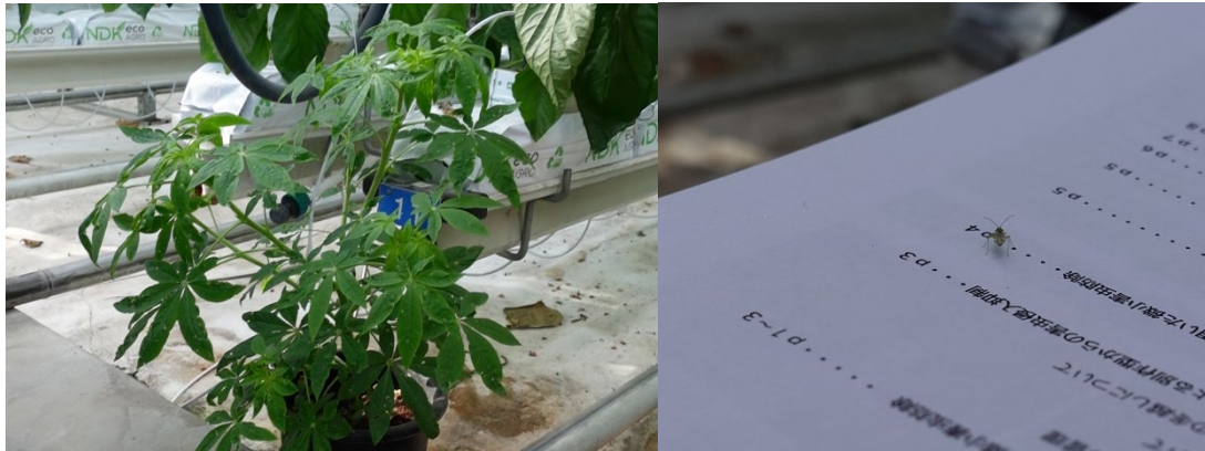
タバコカスミカメのバンカー植物（左：クレオメ）とタバコカスミカメ（右）